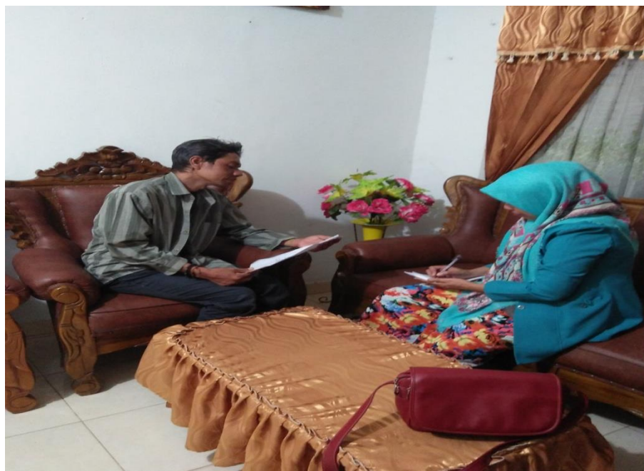
Gambar 4 Wawancara dengan Kepala Tata Usaha