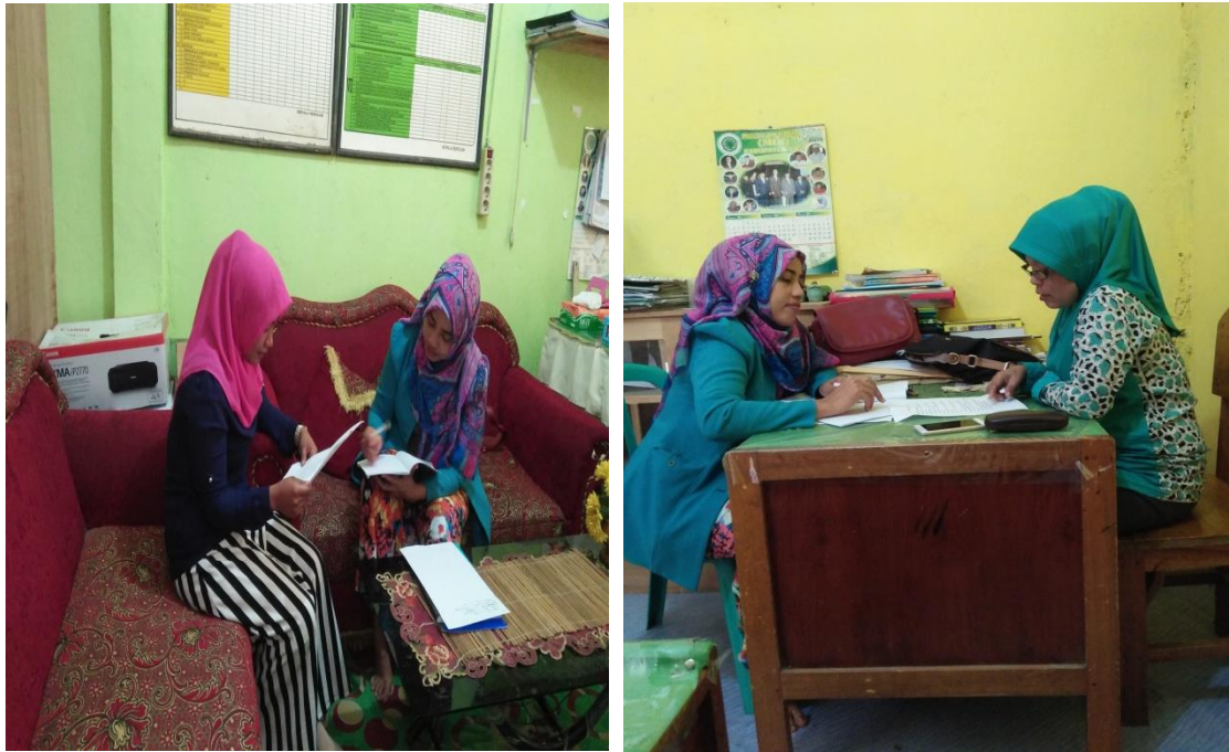
Gambar 3 Wawancara dengan Guru Madrasah Tsanawiyah Alkhairaat Sibalaya