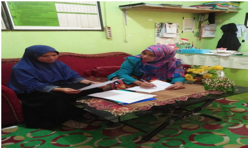
Gambar 2 Wawancara dengan Wakamad Bid. Kurikulum