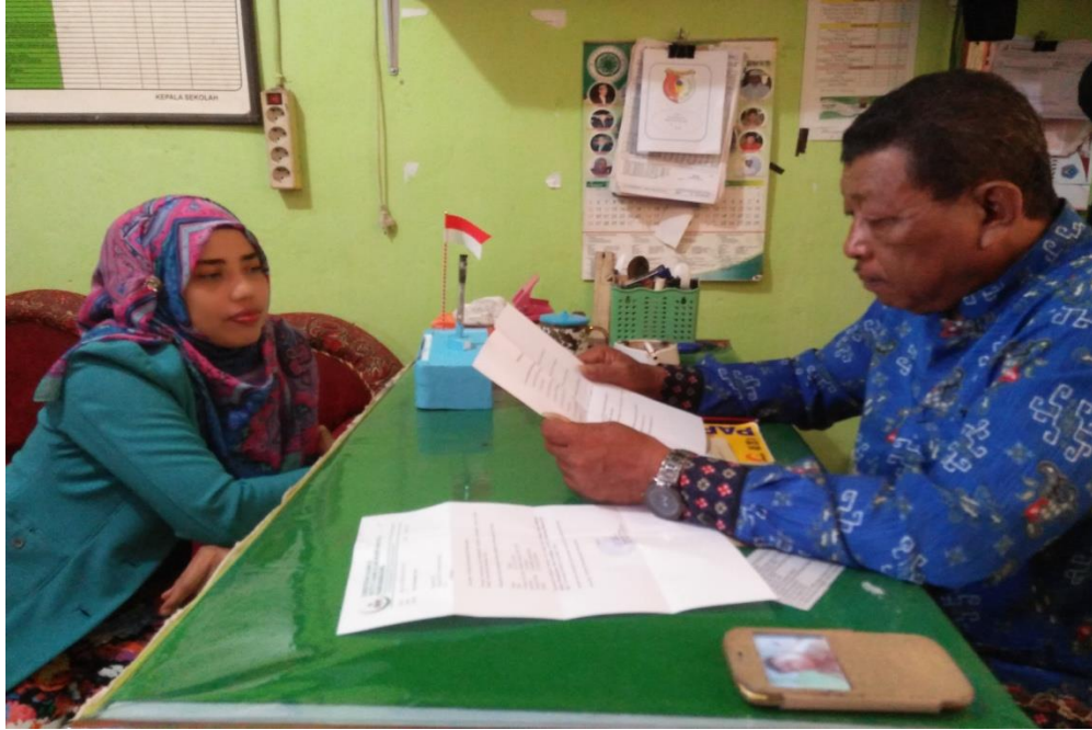
Gambar 1 Wawancara dengan Kepala Madrasah Tsanawiyah Alkhairaat Sibalaya