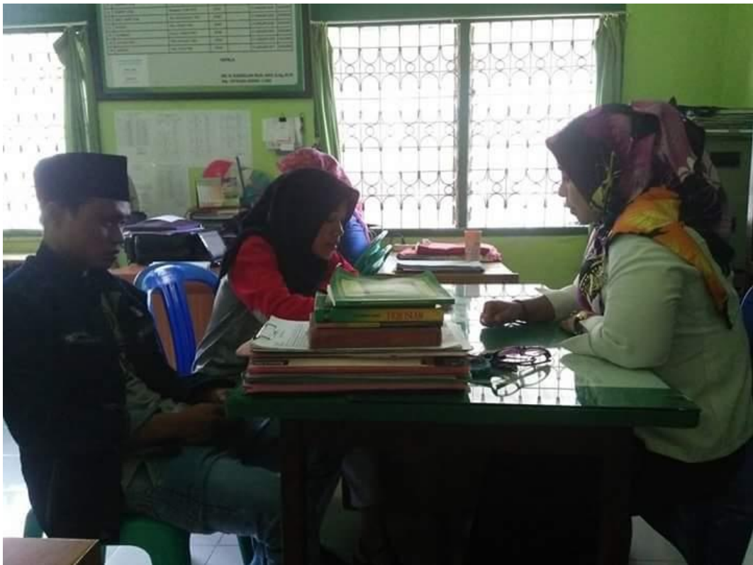
Gambar 7 : Foto kegiatan Bimbingan Pra Nikah