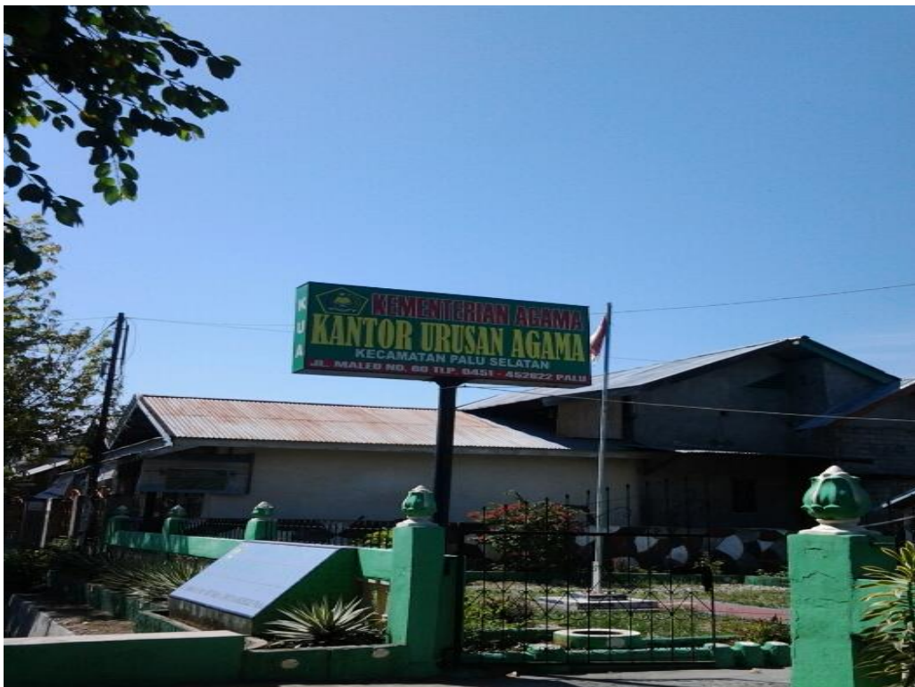
Gambar 1 : Gedung KUA Kecamatan Palu Selatan