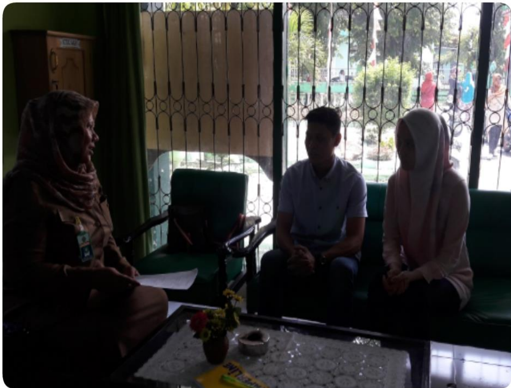
Gambar 6 : Wawancara bersama calon pengantin