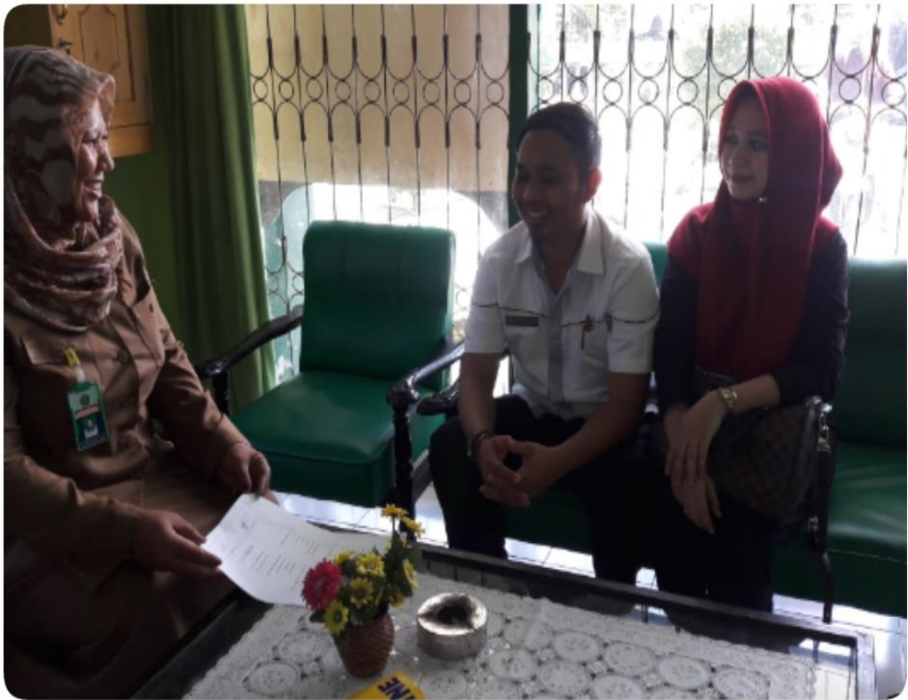
Gambar 5 : Wawancara bersama calon pengantin